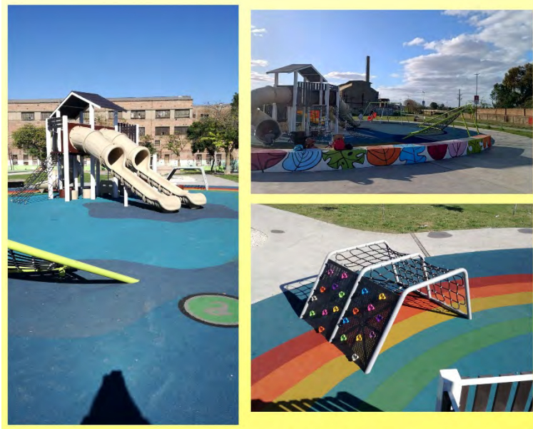
Figura 3: Plaza Carlos Dopazo

Nota: Plaza Carlos Dopazo, de reciente inauguración municipal en el barrio de Villa Castellino denominación histórica del barrio de Piñeyro. Zona tradicionalmente fabril. Se aprecia la intervención de la superficie y la instalación de estructuras lúdicas contorneadas por el paisaje de fábricas abandonadas como la SIAM, ícono de la industria nacional argentina.