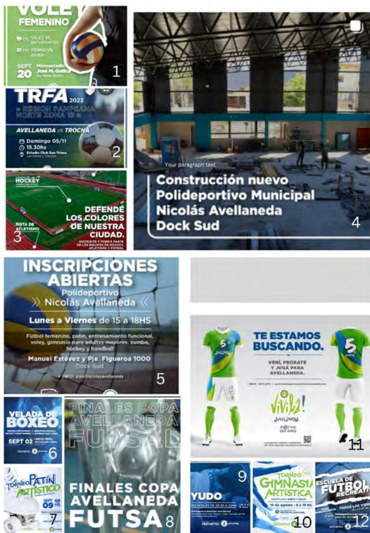
Figura 1: Difusión de acciones

Nota: Imágenes publicadas por la gestión municipal: 1, 2 y 8: anuncio de partidos de vóley y fútbol. 7 y 10: torneo de patín y gimnasia artísticos. 6: muestra de boxeo. 3, 5, 9, 11 y 12 convocatoria a participar diversos deportes. 4: difusión de la construcción de nuevo polideportivo