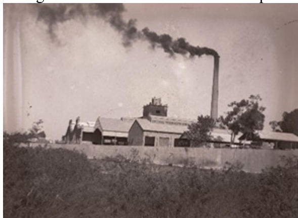
Figura 5. La fábrica a la vera del Suquía

Nota. Imagen CDA/UNC – Colección Antonio Novello