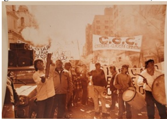
Figura 6. Protesta en las calles de Córdoba, 1998.

Nota. Foto archivo Museo Cervecería Córdoba