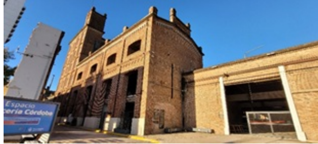
Figura 11. Calle interna de la CC, donde se realizan la mayor parte de las actividades

seleccionado y al momento de este esta narración se está ejecutando el cerramiento mencionado.