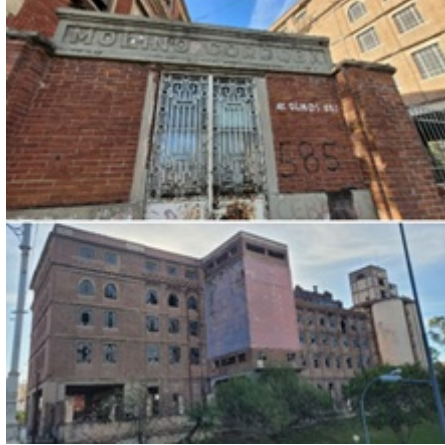
Figura 2. Molino Córdoba. Barrio General Paz. Ciudad de Córdoba