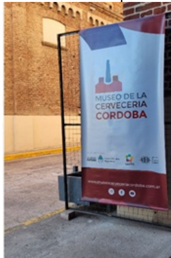
Figura 12. Infografía del Museo de la Cervecería Córdoba en uno de los eventos realizados en el predio