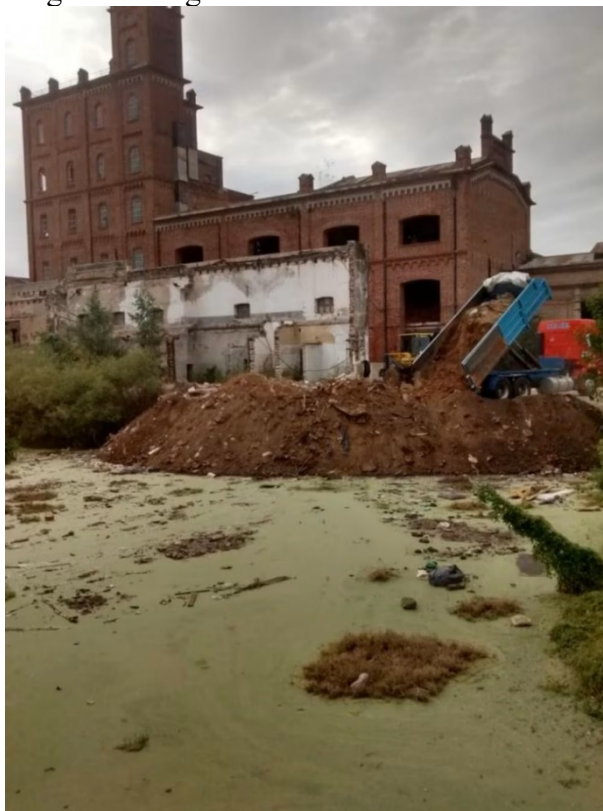
Figura 7. Laguna con agua estancada en zona demolida de la CC.

estancada, escombros y restos de la edificación dispersos, basura y plagas conformaron un lugar insalubre y peligroso presto al vandalismo (Figura 7).