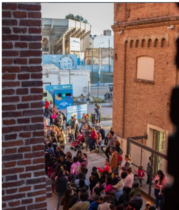
Nota. Imagen RRSS Museo Cervecería Córdoba