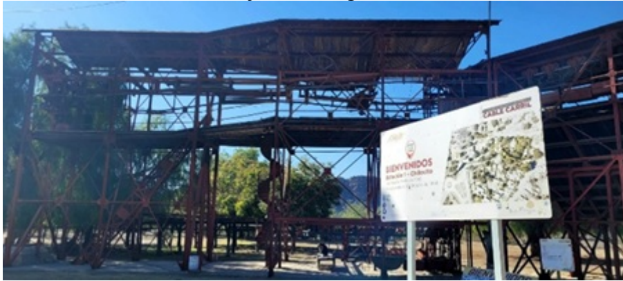
Figura 3. Cable carril, minera La Mejicana inaugurado en 1904. Chilecito, La Rioja,